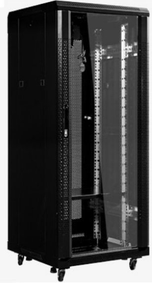
27U 1.4米 1400x600x600